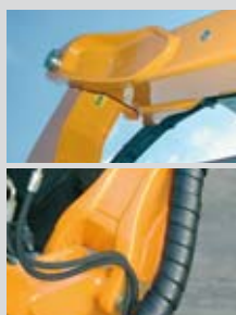
Elementi stampati per le articolazioni dei bracci