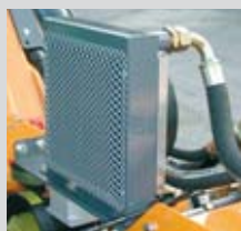
Scambiatore di calore con termostato (optional)