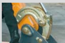
Elementi stampati per la articolazione della testata