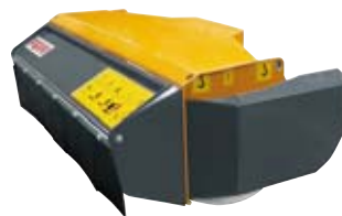
TNS125 Trasmissione diretta