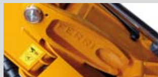
Elementi stampati per l'articolazione dei bracci.