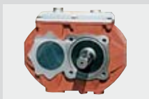
Moltiplicatore in ghisa "HP" (high performance)