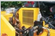
Scambiatore di calore con termostato