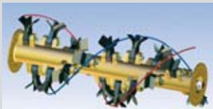
Rotore elicoidale "OVERLAP" a doppia elica con coltelli sovrapposti