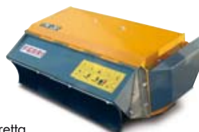
TN120 Trasmissione diretta