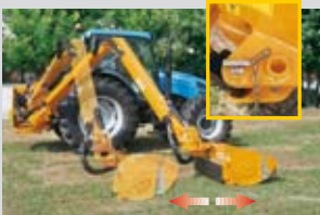
Predisposizione per posizione arretrata