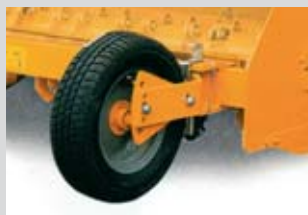
Ruote in gomma sterzanti e regolabili in altezza.