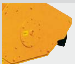
Cuscinetto interno del rotore.