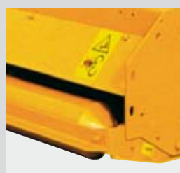
Rullo di appoggio regolabile in altezza.

Trinciatrici per erba e sarmenti, set-aside, ecc. ( \varnothing max 6 cm)