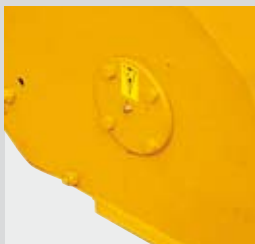
Cuscinetto interno del rotore.

TRINCIATRICI PER ERBA E CESPUGLI (Ø max 1,5 cm)