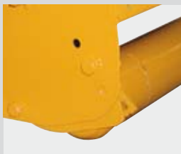
Rullo d'appoggio regolabile in altezza.