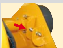
Tendicinghie a vite per il tensionamento delle cinghie.