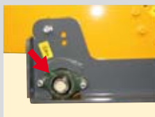
Rullo di appoggio con 6 diverse posizioni di regolazione.